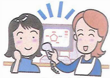
肌診断器(スキンビジウム)

「いまの肌を知ること」から 本当のスキンケアがはじまります。 誰もが本来もっている美しさを育むための「肌の基礎力」を お調べします。